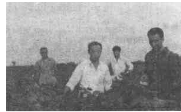
△ 利津县保险公司... 为公司经理和业