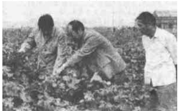
日前,省人大副主任王树芳(左一)等在市人大主任唐生海的陪同下,考察了我市棉花开发及黄河水的利用情况,并在利津就棉花开发问题进行了座谈。